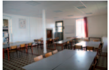
Le réfectoire salle dessin d'art

L'Amicale et l'Établissement scolaire Sainte-Marie – La Grand'Grange se sont mobilisés afin de réussir ce projet. Chacun assura la réalisation et le financement d'une partie des travaux suivant un programme défini à l'avance. La mission de l'Amicale : faire place nette à la cuisine. Quelques jours de travaux suffirent durant le mois de mai. Les entreprises consultées assurèrent le démontage et l'évacuation du matériel lourd : cuisinière acier et fourneau en fonte, hotte d'aspiration, faux plafond inutilisable en l'état, éviers divers, chauffe-eau hors d'usage, etc.... puis raccordements divers, alimentation eau chaude et froide. Le 25 mai, l'Amicale rendait sa copie mission accomplie.