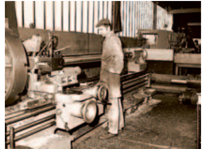
1 er atelier à Saint-Julien-en-Jarez