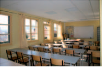
Ancienne cuisine : nouvelle classe

2007 aura été une année riche en réalisations nouvelles. D'importants investissements prévus fin 2006 ont été réalisés au cours des mois de juin et juillet 2007 au Lycée Professionnel (voir Bulletin n° 147 juin 2007).