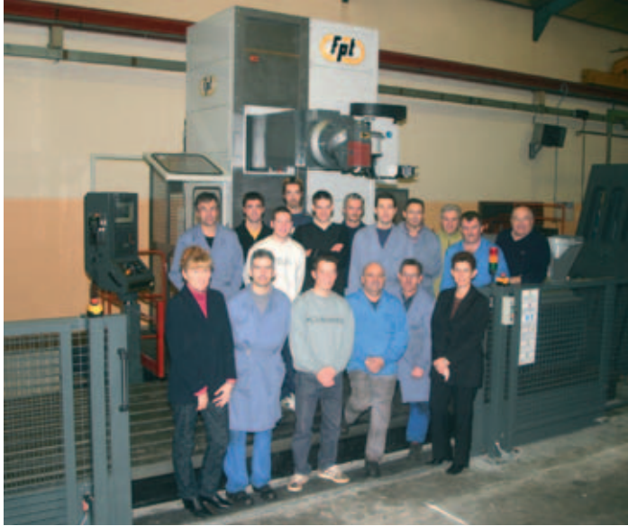
Aléseuse-Fraiseuse FTP grande capacité en fonction depuis 2006