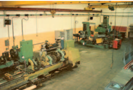
Notre Atelier flambant neuf en 1982.

Grâce à la qualité de notre travail et à notre disponibilité nous avons vite acquis une bonne clientèle dans divers domaines (équipement caoutchouc, sidérurgie, plastique, travail du verre). L'effectif est passé rapidement de trois à dix personnes.